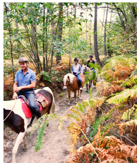
Ferme des Bleuets Sarthe Tourisme © Pascal Beltrami