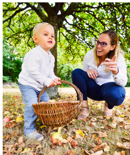
Ferme de la Haie - Cerfs du Perche