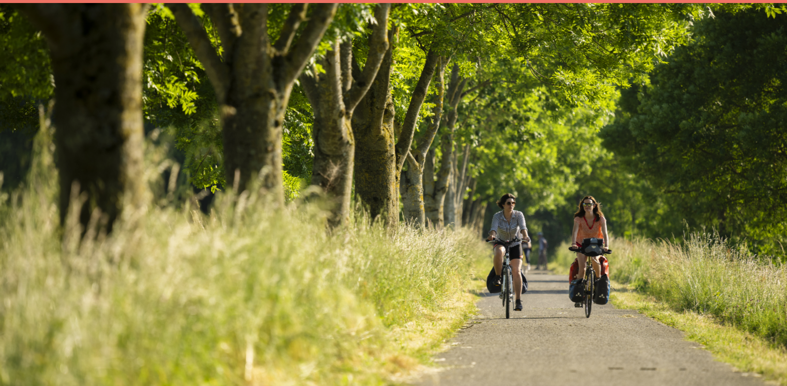
La Vélobuissonnière, Boulevard Nature, Le Mans - Sarthe Tourisme © Pascal Beltrami