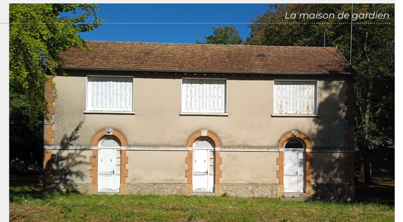
La maison de gardien