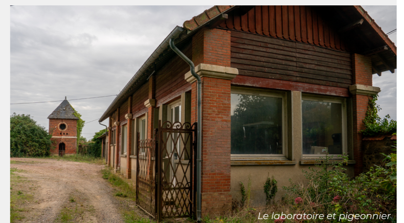
Le laboratoire et pigeonnier