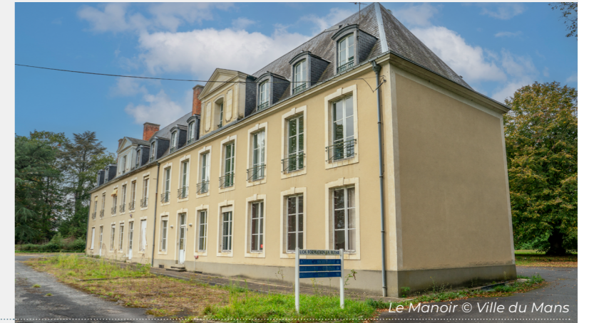
Le Manoir