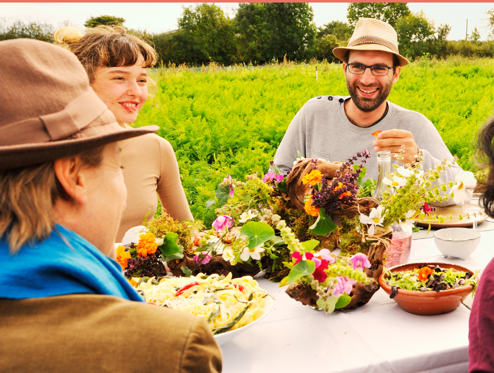
Jardins Souvre