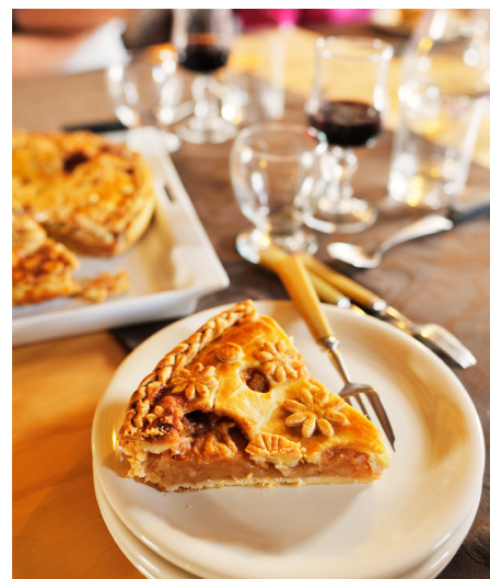
Louise Cuisine Sarthe Tourisme

La stratégie touristique de Le Mans Métropole a identifié un manque dans l'offre d'hébergements du territoire. En effet, le territoire est doté d'une offre hôtelière avant tout d'entrée de gamme, centrée sur les flux économiques. La collectivité aspire à créer une diversité de propositions plus adaptées au tourisme d'agrément.